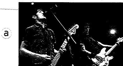
les membres du groupe Sum 41